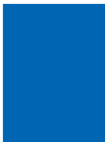
230 x 300 mm (ohne Beschnitt) mit Beschnitt: 236 x 306 mm

Preise in CHF und € Euro, Anschnitt-Formate