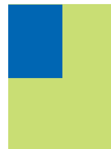
90 x 125 mm (ohne Beschnitt) mit Beschnitt: 96 x 131 mm