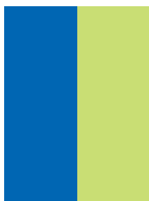
115 x 300 mm (ohne Beschnitt) mit Beschnitt: 121 x 306 mm