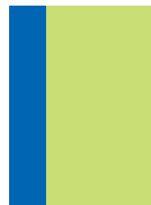
57 x 300 mm (ohne Beschnitt) mit Beschnitt: 63 x 306 mm